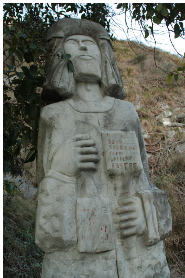
22. “Non dirmi chi sono... sono colui che tu vorresti essere. Dimmi chi sono... non dirmi chi ero.” Particolare.

[4] La collina delle Canalie è parte del massiccio del monte Pizzone.