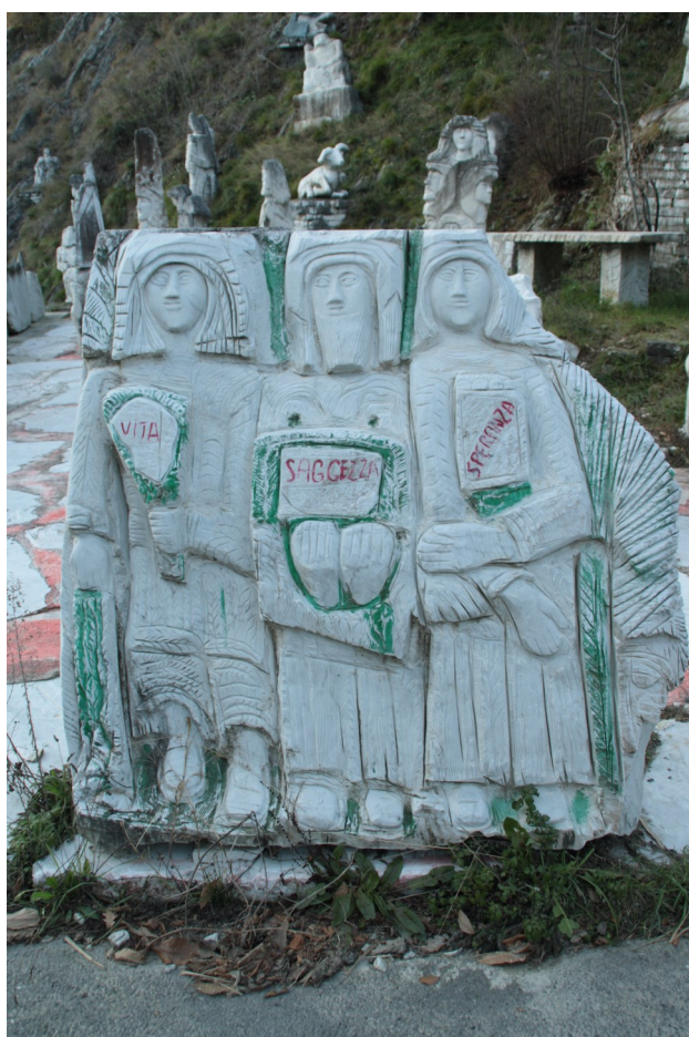
19. Vita Saggiezza Speranza.

[1] Quando per la prima volta mi sono dedicata all'arte di Mario Del Sarto il sito non aveva un nome ufficiale, nemmeno l'artista gliene aveva