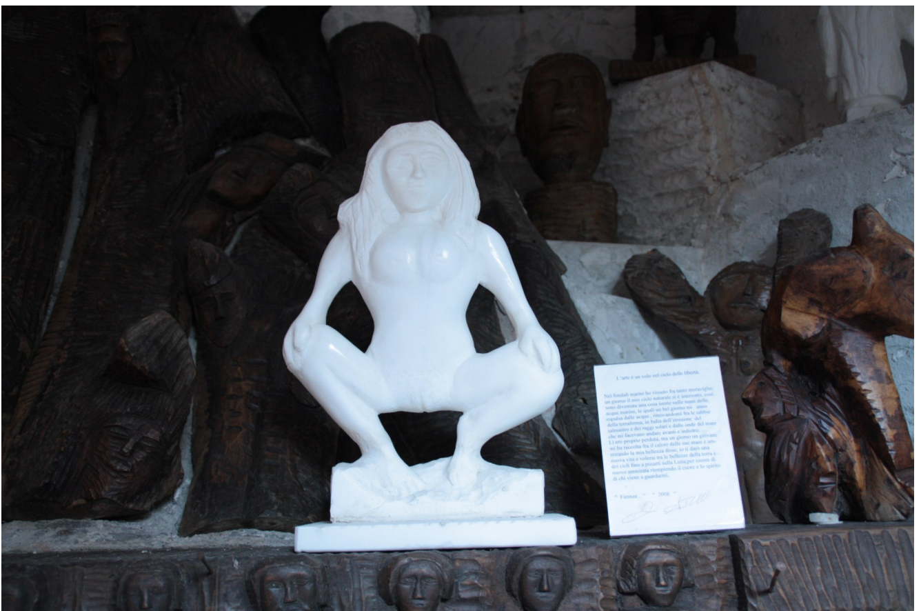
13. Donna che urina. Di piccole dimensioni e dall’aspetto levigato. Il soggetto è senz’altro irriverente, ma la posizione della donna suggerisce collegamenti con figurazioni antiche di divinità legate al parto e alla fertilità femminile.

Come detto negli ultimi anni Del Sarto ha smesso di scolpire e si è limitato a dipingere sulle sue opere; si tratta di interventi cromatici per lo più di ridotta estensione, impiegando una ridotta gamma cromatica (blu/azzurro, rosso, giallo, verde, bruno). Generalmente sono interessate dal colore le opere in bassorilievo