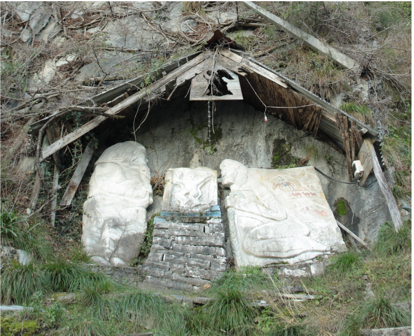
1. Presepe allestito sul fianco della collina delle Canalie, nei pressi del laboratorio di Mortarola (Massa-Carrara). Sopra la capanna sulla sinistra (non visibile) è collocata un'aquila, per l'artista simbolo di forza; al centro in alto un angelo, simbolo di amore; infine, sulla destra una colomba indica la pace.