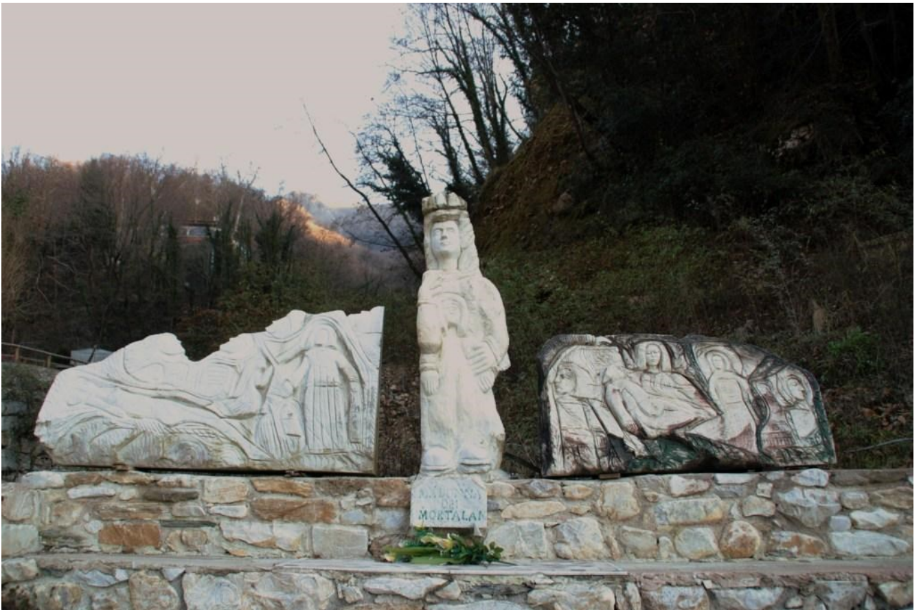
4. Madonna dei Mortalari.