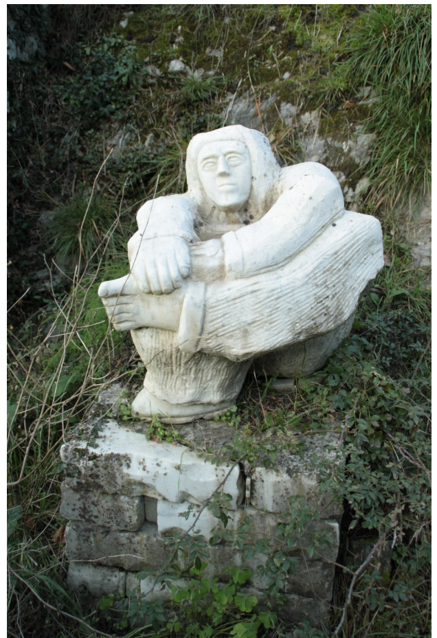
12. Uomo seduto con le gambe incrociate. La posizione della figura richiama “lo spinario”, un soggetto tipico della statuaria ellenistica ripreso nel Rinascimento italiano.

Un altro tema caro e ricorrente nella Via scolpita è l’ammaestramento morale. Diverse opere portano incise frasi che vogliono colpire e spingere l’osservatore alla riflessione. Alcune sono più provocatorie come Il piede della giustizia (fig. 18), altre invitano a una riflessione più profonda, esistenziale, come quella che potremmo intitolare Vita Saggezza Speranza , una lastra dove tre figure portano ognuna una tavoletta con una di queste parole. Tre parole non scelte a caso, ma elementi per l’artista essenziali e concatenati (fig. 19).