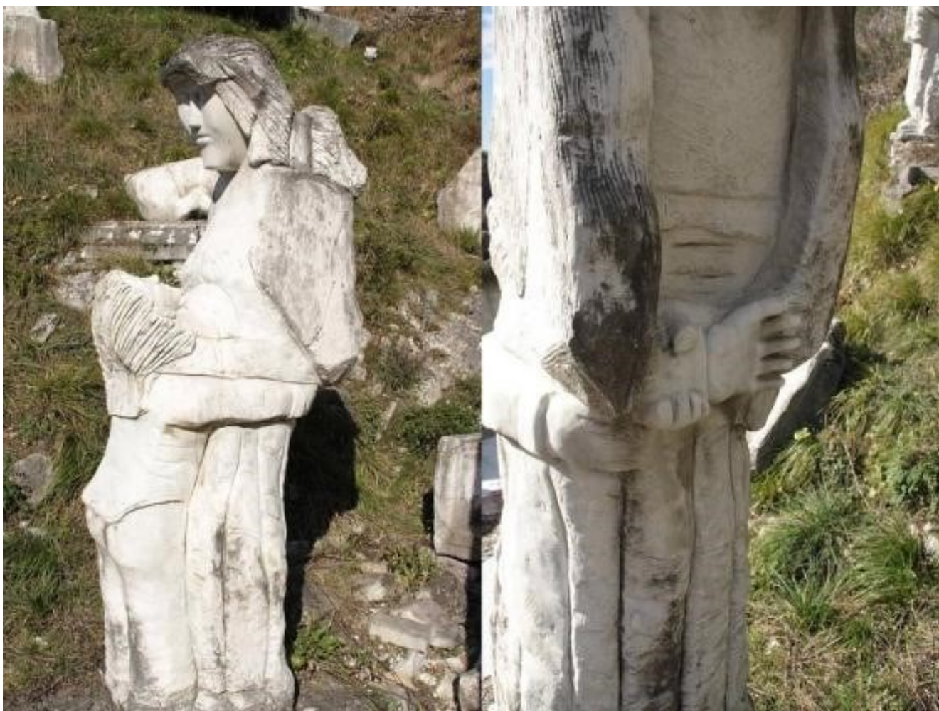
16. Madre con figlio. Opera che parla della difficoltà della separazione: ogni soggetto ha un doppio paio di braccia, la madre ad esempio abbraccia il figlio e al tempo stesso si tiene le mani dietro la schiena consapevole che è venuto il momento di lasciarlo andare per la sua strada.

scuole. Il fatto che la maggior parte delle opere sia in marmo, un materiale resistente, lascerebbe credere che il sito necessiti di poca manutenzione, ma non è esattamente così. Per quanto la Via scolpita possa essere considerata più "autonoma" rispetto ad altre installazioni fantastiche, le opere necessitano comunque di regolare manutenzione e controllo; sebbene poi il sito si trovi in una zona di scarso passaggio, aspetto che al momento può tenerlo al sicuro, nel momento in cui diventasse più conosciuto potrebbe esporlo ad attenzioni indesiderate e vandalismi difficili da monitorare senza un sistema di sorveglianza, proprio per via del suo