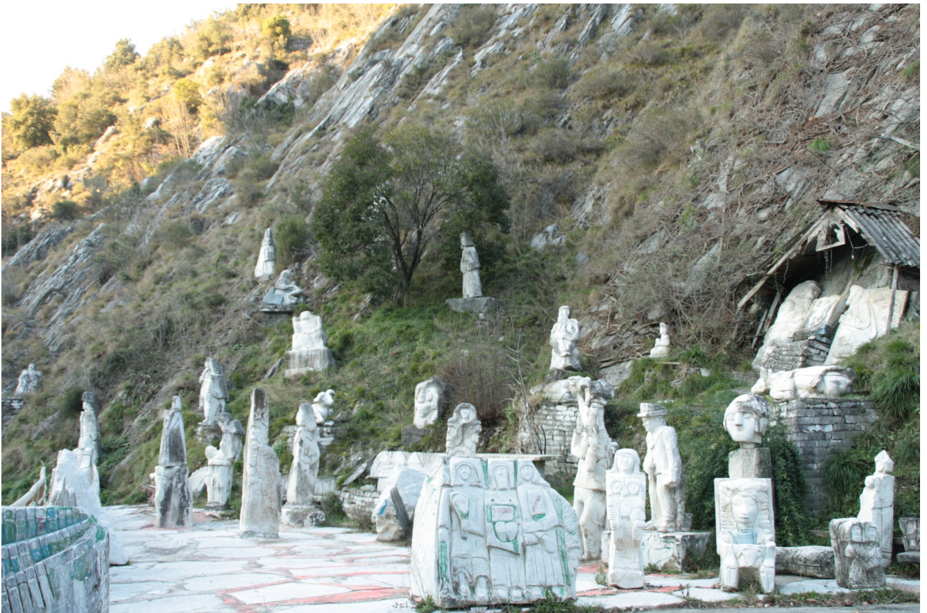
10. Porzione iniziale della Via scolpita.

Uno dei soggetti più ricorrenti è quello familiare: madri e figli, padri e figli, o nuclei familiari. In certi casi queste opere riflettono sul tempo, l'alternarsi delle generazioni, la crescita e la vecchiaia così come succede con Madre con figlio (fig. 16) e con Uomo che innalza sulle spalle un giovane (fig. 17). Del Sarto esprime nella sua arte un forte rispetto per la figura materna, soggetto