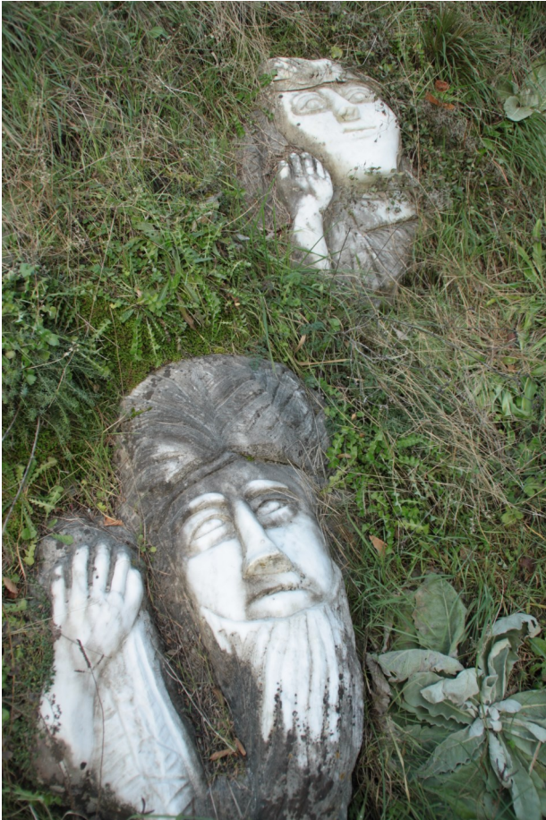
10. Porzione iniziale della Via scolpita .

ripreso più volte, come per il ruolo procreatore della donna. Il tema stesso della nascita e del riportare alla vita è a lui molto caro dato che del suo lavoro dice: “si chiama ridonare vita a ciò che l’aveva persa. A un sasso buttato via io l’ho ripreso e gli ho ridato la vita. Così almeno lo porti via e non lo distruggerai più. Perché se no questo qui andava a finire in polvere!”.