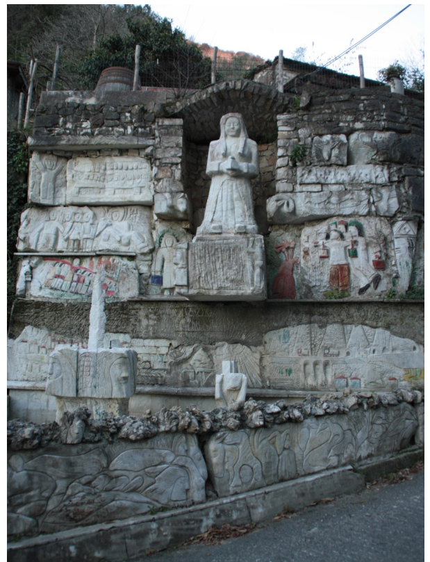
8. La Fontana del Sapere, opera datata 1995, quando l’artista aveva 70 anni. Vi si può leggere una vera summa di storia locale.

Guardando attentamente le opere viene da pensare che Del Sarto abbia comunicato con la storia dell’arte più di quanto lui stesso non creda o dica. Nei suoi lavori si ha l’impressione di riconoscere diversi elementi che rimandano a forme e figure provenienti dal mondo antico: tra le opere si nascondono richiami al neolitico, alla protostoria europea, alla statuaria classica, al mondo romano, tardo antico e romanico; ci sono visioni più simboliste con elementi antropomorfi e fitomorfi che si mescolano, fino ad arrivare a vere e proprie espressioni astratte. Ne viene che guardando le sue opere sembra di per-