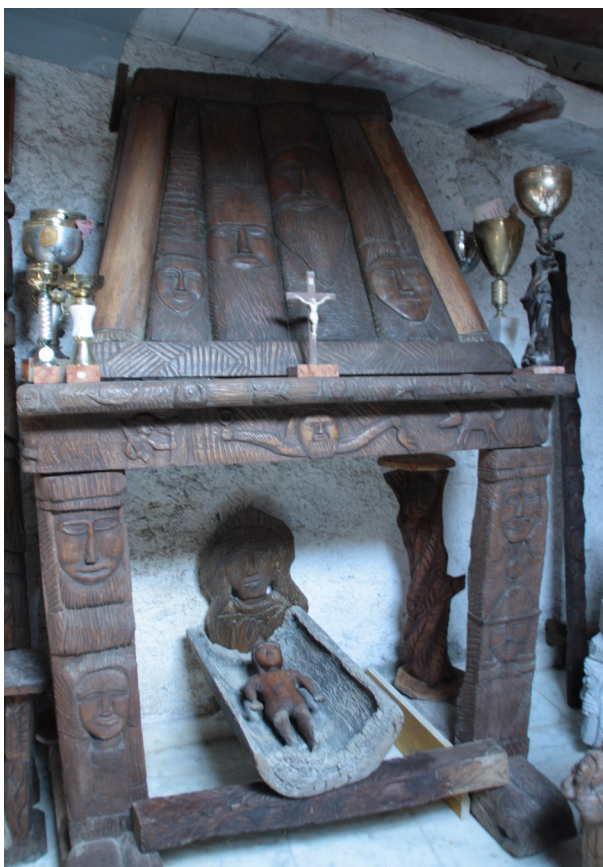
7. Laboratorio dell'artista, caminetto con Sacra Famiglia: al centro Gesù e, alle sue spalle, il volto della Madonna. Nella cornice del camino sono raffigurati volti e scene. Da notare il volto centrale, nella parte superiore, e i suoi tratti antichi che rimandano a raffigurazioni di epoca protostorica (naso triangolare, occhi mandorlati e labbra pronunciate). È interes-

e scolpendolo si sarebbe limitato a liberarle. Però un elemento che non va sottovalutato è il fatto che Mortarola sia non solo il sito della Via scolpita , ma anche e soprattutto il paese dove Del Sarto è nato e cresciuto. Intervenire in maniera così significativa sul luogo in cui si vive (o come nel suo caso, si è vissuto), farsi soggetti attivi nella costruzione e determinazione di questo spazio domestico allargato, non è comune, soprattutto nel modo in cui l'ha fatto Mario Del Sarto. Questo particolare modo di vivere la domesticità di un luogo e l'intervento sul suo aspetto rendono il soggetto una sorta di creatore, un piccolo "dio domestico", che nel