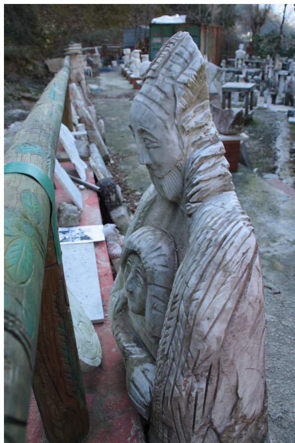
20. Pietà con Cristo che abbraccia la madre.