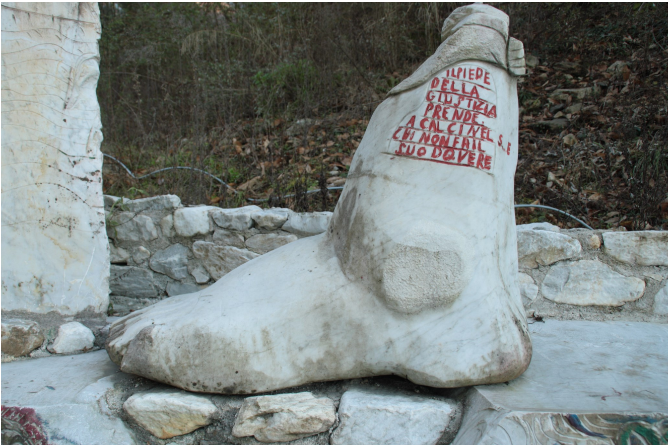
18. Il piede della Giustizia.

“Gesù... lui è andato in cielo, ma la croce ce l'ha lasciata a noi! Capito? Gesù è andato in cielo, ma la croce no, la croce è rimasta a noi! Noi abbiamo la nostra croce sempre dentro di noi. Se vogliamo ragionare come