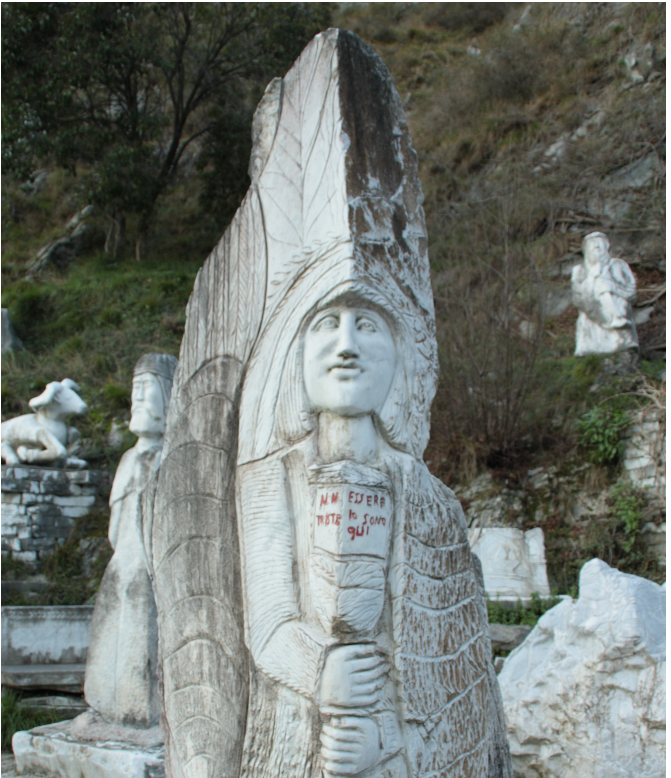
15. Particolare di una scultura bifronte. L'opera reca il messaggio "Non essere triste, io sono qui".

le e alla nascita magari di una piccola casa di accoglienza o di un centro studi. Esempi di questo tipo ne stanno nascendo diversi in Italia, percorsi escursionistici alla riscoperta di luoghi e antichi percorsi, lungo i quali di rifles-