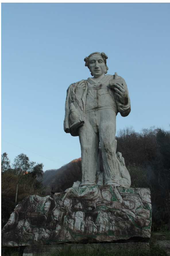
21. Lo Spartano.

[3] Oreste Paliotti, Lo raccontano i sassi , https://www.cittanuova.it/lo-raccontano-i-sassi/?ms=004&se=028 , consultato il 31 dicembre 2020.