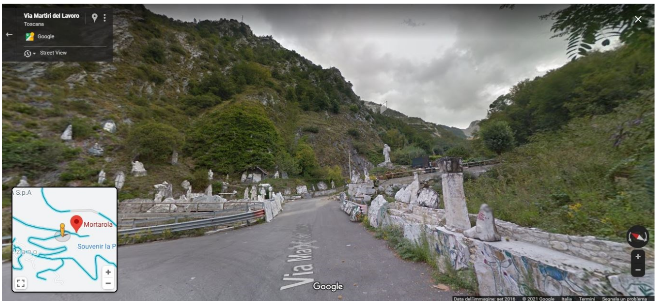
3. Colpo d'occhio della Via scolpita come è possibile vederla cercando con Google Maps la località Mortarola.