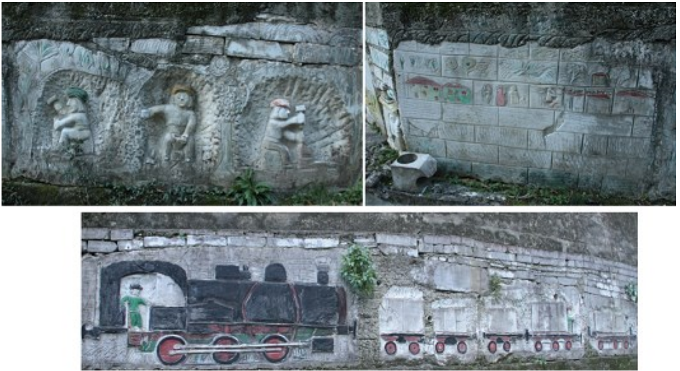
9. Muro della Sapienza, opera datata 1990. L'artista aveva allora 65 anni e l'opera presenta elementi biografici come la grande locomotiva della marmifera.

correre un lungo viaggio nella storia del linguaggio visivo dell'umanità (figg. 12, 13, 14). Queste tracce danno l'impressione che Del Sarto, nonostante il breve percorso scolastico, in realtà abbia letto e visto molto. Parlando con lui non è facile capire quanto e cosa abbia letto, se interrogato vi risponderà che non ha studiato niente e fa quello che il marmo gli dice, ma il dubbio rimane. Una risposta, forse, la si può trovare nella piccola libreria del suo laboratorio, dove sono presenti diversi testi di arte, e nei suoi viaggi (Roma, Parigi). Già questo può in parte spiegare certi rimandi, certe impressioni, che probabilmente Mario ha raccolto nella sua vita, tra letture e visite, e poi ha riversato o reinterpretato nei suoi lavori.