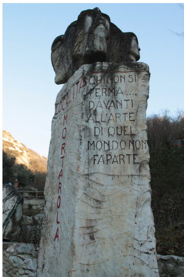
5. Cippo con nome della località, Mortarola, e motto, sormontato da un capitello con volti umani e animali (si riconoscono un uomo barbuto e un capro). Stile e soggetti del capitello ricordano esempi di epoca romanica.